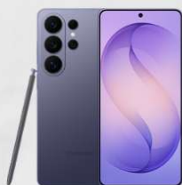
SAMSUNG Galaxy S26 Ultra