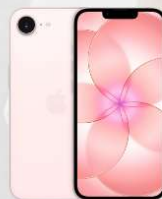
Apple iPhone 17e