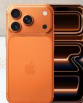
Apple iPhone 17 Pro

以上服務計劃(「服務計劃」)屬企業優惠,只適用於指定企業的現任員工。5G服務計劃使用5G網絡。只適用於指定5G網絡覆蓋地區及客戶需使用指定可支援的裝置。客戶所體驗之實際速度會相當地少於最高下載速度,並會因應所使用之裝置、地點、網絡情況及其他因素而有所影響。(如適用)每月港幣18元行政費亦適用於以上所有計劃。(如適用)客戶如同時選購智能裝置,須預繳機價(金額視乎所選擇的裝置型號),而預繳金額將於承諾期內分期回贈至客戶的1010賬戶內。如客戶之月費及智能裝置組合合約完成後,其後月費將調整至當時之等本地數據用量攜機上台服務計劃之月費。CSL並非禮品之生產商或供應商,故此不會承擔與禮品有關之任何法律責任。所有禮品均不可兌換為現金。 Δ 選用中國內地及澳門數據漫遊組合即代表您已同意開放IDD及漫遊服務並同意「開啟流動數據漫遊服務」。 ^ 數據漫遊通行證只適用於中國內地、日本、南韓、台灣、泰國、澳洲、柬埔寨、印度、印尼、馬來西亞、紐西蘭、菲律賓、新加坡及越南。受條款及細則約束,CSL保留一切決定之最終決定權。以上優惠如有任何變動,恕不另行通知。優惠期至2026年7月31日。