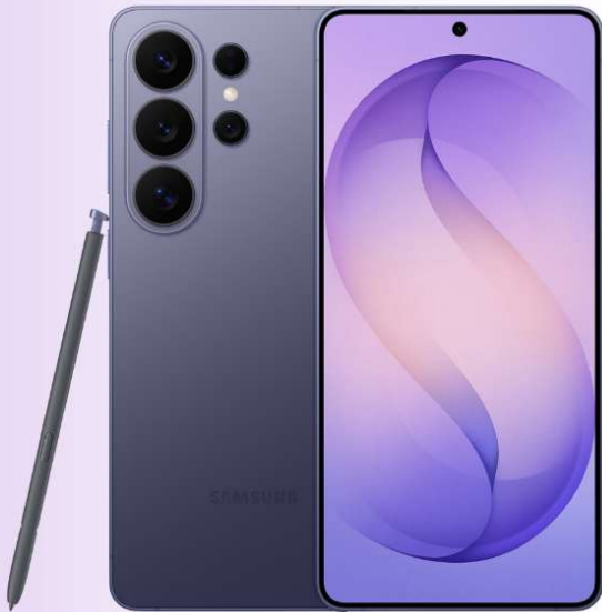
Galaxy S26 Ultra 價值$11,798