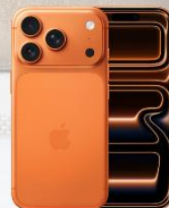
Apple iPhone 17 Pro

以上服務計劃(「服務計劃」)屬企業優惠,只適用於指定企業的現任員工。5G服務計劃使用5G網絡。只適用於指定5G網絡覆蓋地區及客戶需使用指定可支援的裝置。客戶所體驗之實際速度會相當地少於最高下載速度,並會因應所使用之裝置、地點、網絡情況及其他因素而有所影響。(如適用)每月港幣18元行政費亦適用於以上所有計劃。(如適用)客戶如同時選購智能裝置,須預繳機價(金額視乎所選擇的裝置型號),而預繳金額將於承諾期內分期回贈至客戶的1010賬戶內。如客戶之月費及智能裝置組合合約完成後,其後月費將調整至當時之等本地數據用量攜機上台服務計劃之月費。CSL並非禮品之生產商或供應商,故此不會承擔與禮品有關之任何法律責任。所有禮品均不可兌換為現金。△選用中國內地及澳門數據漫遊組合即代表您已同意開啟IDD及漫遊服務並同意「開啟流動數據漫遊服務」。^數據漫遊通行證只適用於中國內地、日本、南韓、台灣、泰國、澳洲、柬埔寨、印度、印尼、馬來西亞、紐西蘭、菲律賓、新加坡及越南。受條款及細則約束,CSL保留一切決定之最終決定權。以上優惠如有任何變動,恕不另行通知。優惠期至2026年7月31日。