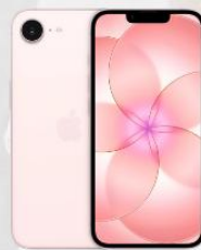
Apple iPhone 17e