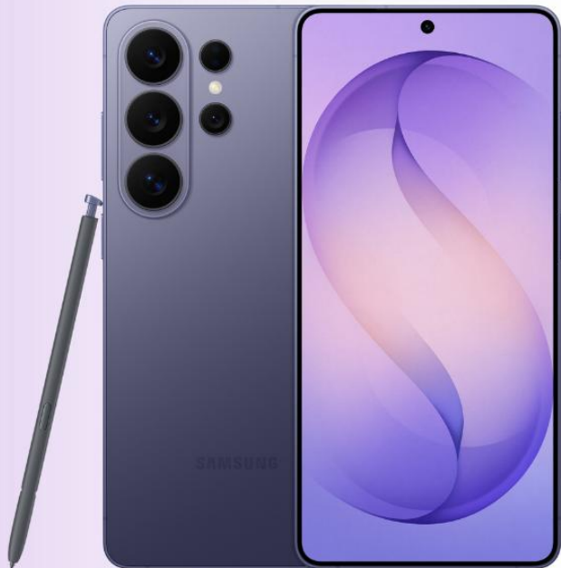
Galaxy S26 Ultra 價值$11,798