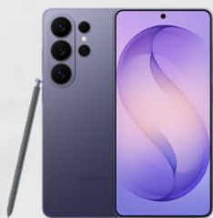
SAMSUNG Galaxy S26 Ultra